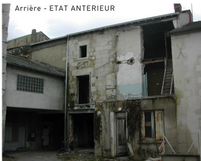
Arrière - ETAT ANTERIEUR