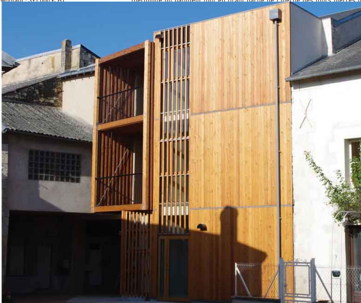
Arrière - PROJET REALISE

Le projet a consisté à rendre indépendant le local commercial en Rdc et à créer 2 logements T3 superposés en étages. La façade sur rue a été restaurée pour mettre en valeur sa modénature architecturale. La façade arrière a été entièrement recomposée de manière contemporaine. Une construction en ossature bois a été accolée à l'existant intégrant la cage d'escalier commune des logements et leurs balcons. La rénovation comporte aussi une amélioration thermique du bâtiment tout en tirant partie de l'inertie des murs pierres pour le