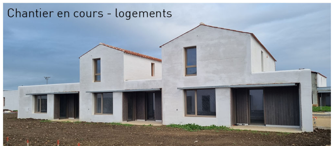
Chantier en cours - logements