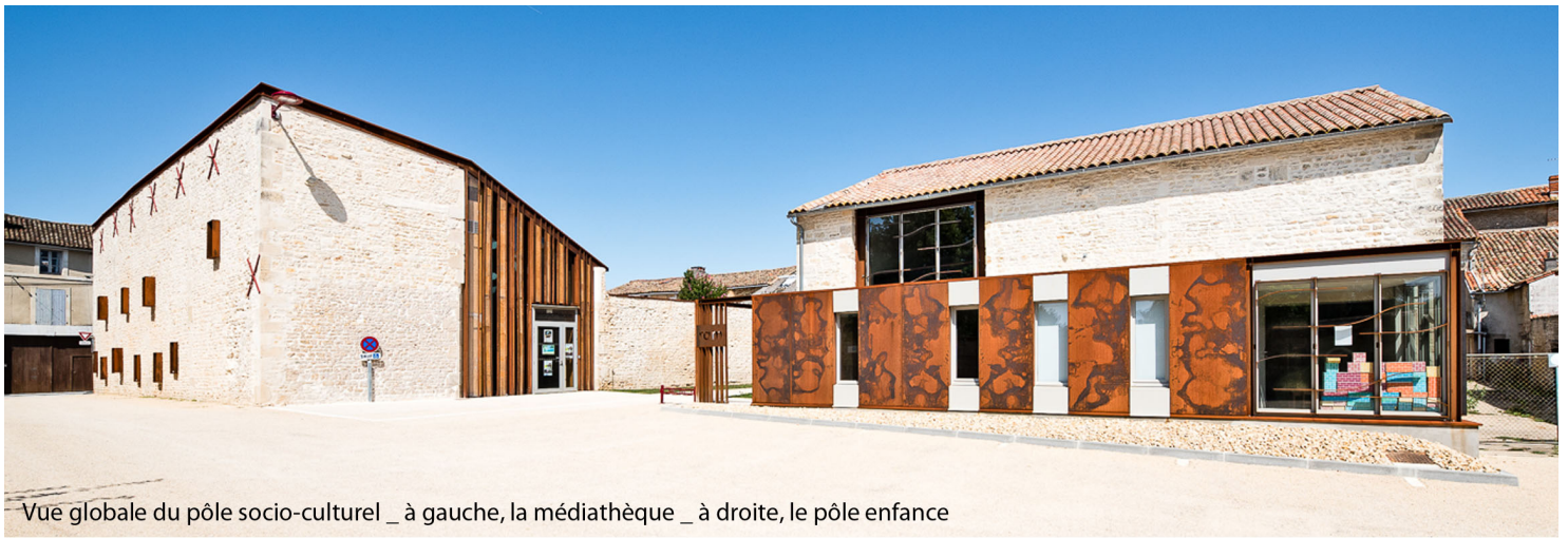
Vue globale du pôle socio-culturel _ à gauche, la médiathèque _ à droite, le pôle enfance