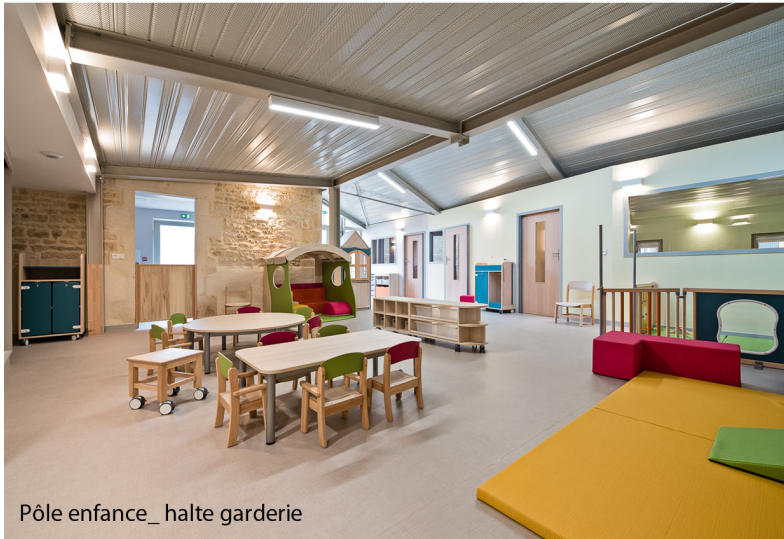
Pôle enfance_ halte garderie