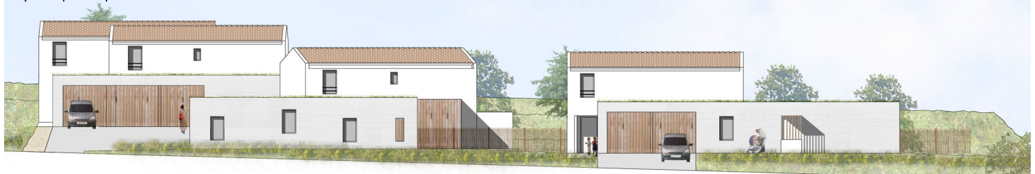
Garages T2 , T3-d et T3-e